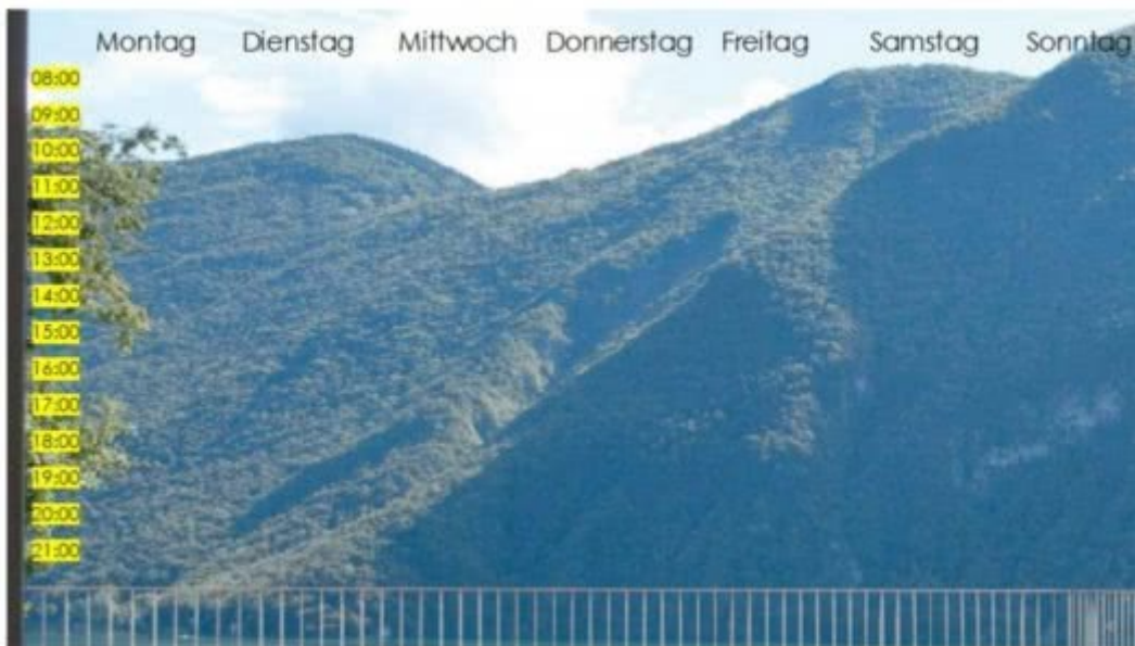
Une grille hebdomadaire sur un mur ou une fenêtre, avec les jours de la semaine et les heures Résultat final