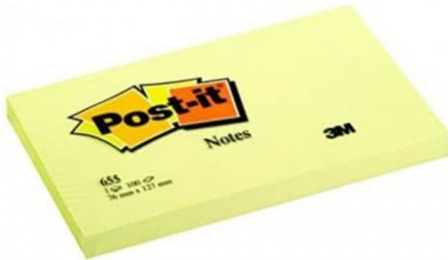
Un bloc de post-it