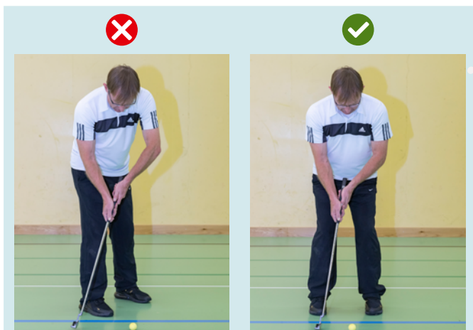
Il giocatore non è rivolto parallelamente alla linea di tiro, address sbagliato