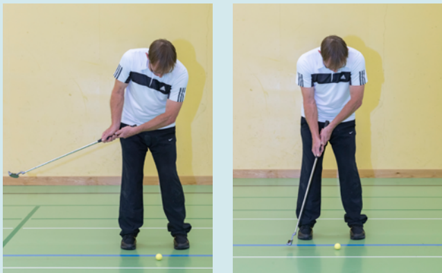
Il movimento a ritroso è troppo ampio e rivolto verso il basso, con conseguente posizione rialzata della testa del bastone sopra il suolo